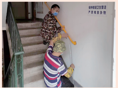
广和里社区安装爱心扶手