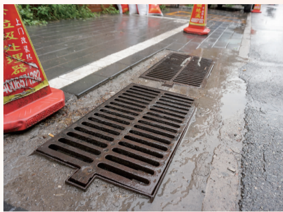
维修后新增的下水道雨算