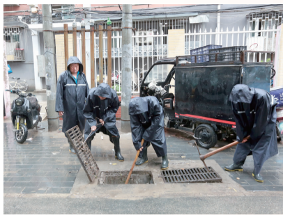
工作人员雨中清理下水道淤堵